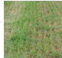
Nachsaat nach einer Woche/Nachsaat auf Altbestand