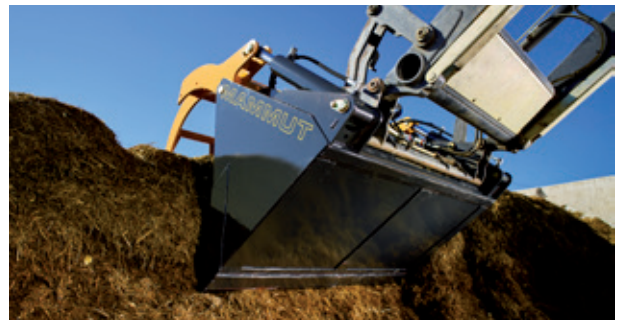
Der Einsatz der Silogreifschaufel ist auch auf kleinen Trägerfahrzeugen problemlos möglich.