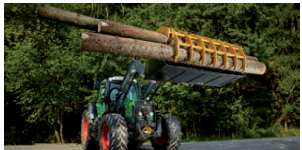
Jedes Transportgut wird perfekt fixiert und sicher transportiert.