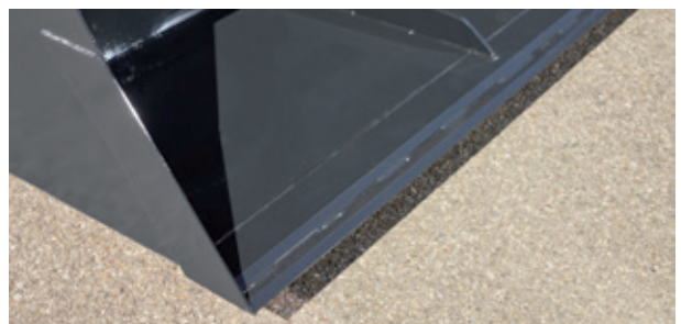
Die Hardox-Schürfleisten garantieren eine lange Lebensdauer der Greifschaufel.