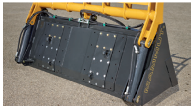
Die geschraubten Anbauten können jederzeit ohne großen Aufwand gewechselt werden.