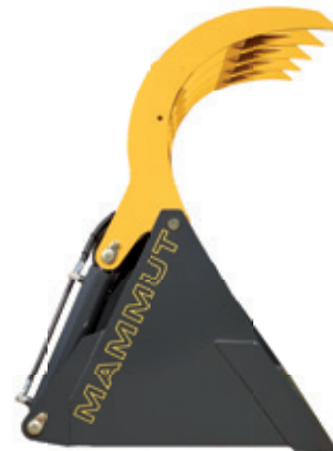
Der Greifer der Silo Grip Smart steht (im geöffneten Zustand) nicht über dem Schaufelboden vor.