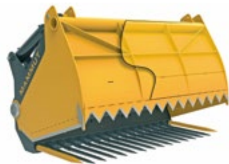
Dank der durchdachten Konstruktion des Schneidkorbes kann auf ein Mengenteilerventil verzichtet werden.