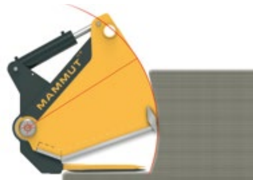
Die optimal gewählten Drehpunkte nähern sich an die „neutrale Phase“ an.