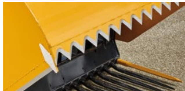
Die geschweißte Hardox-Schneide sorgt für wenig Schneidwiderstand im Silo.

Zum anderen spielt aber auch die Leichtzügigkeit eine große Rolle: Die geschweißte Schneide und optimale Drehpunkte der Zange ermöglichen einen leichtzügigen Schnitt, somit auch geringeren Widerstand im Silo und weniger Belastung von Zange und Trägerfahrzeug.